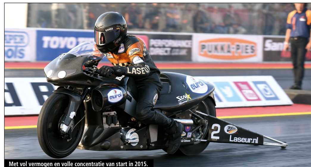
Met vol vermogen en volle concentratie van start in 2015.

Mijn eerste impuls is om nu te zeggen: 'ik mis mijn haar'. Vroeger had ik heel lang haar. Maar nee, ik hoef niks te veranderen. Ben daar helemaal niet mee bezig. Als je maar gezond ben, dat is zoveel belangrijker.